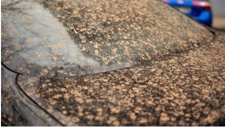
Photographie de sable du Sahara dans les Pyrénées en France.

1) Sur la carte vierge, REPORTER les informations utiles permettant de résoudre le problème.